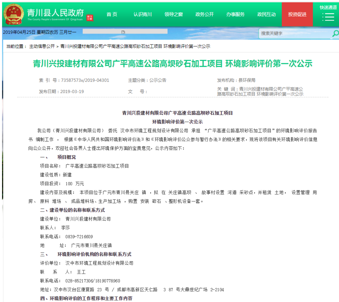
图 2-1 首次环境影响评价信息网络公开截图