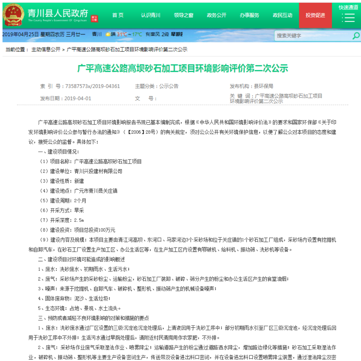
图 3-1 征求意见稿网络公示截图