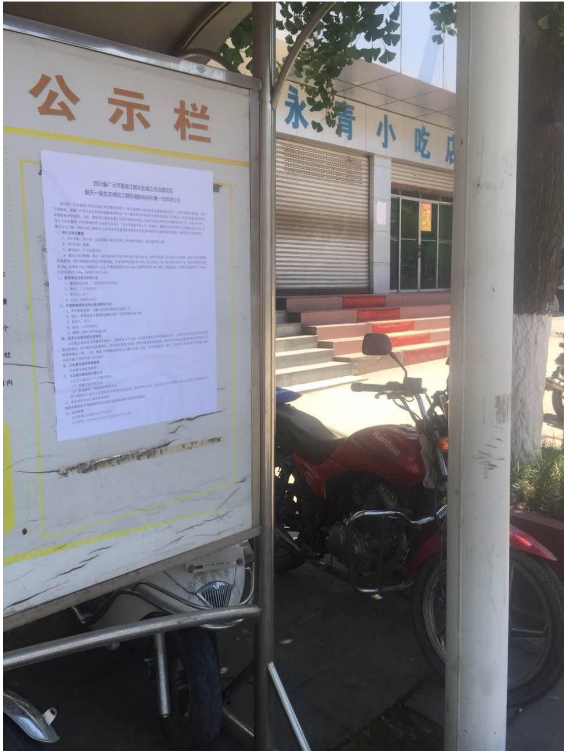
图 3-7 现场张贴公示照片