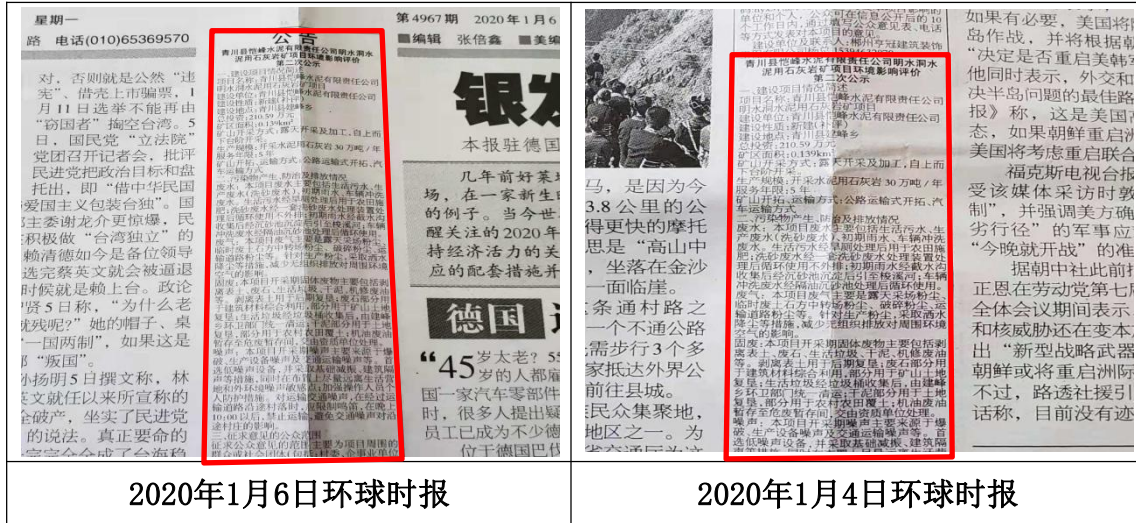
图3 项目报纸公示图片

建设方在建设项目所在地公众易于接触的报纸（环球时报）上进行公开，且在征求意见的10个工作日内公开信息不得少于2次；本次调查过程严格按照《环境影响评价公众参与办法》的相关要求进行。